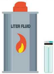
ライター・オイル