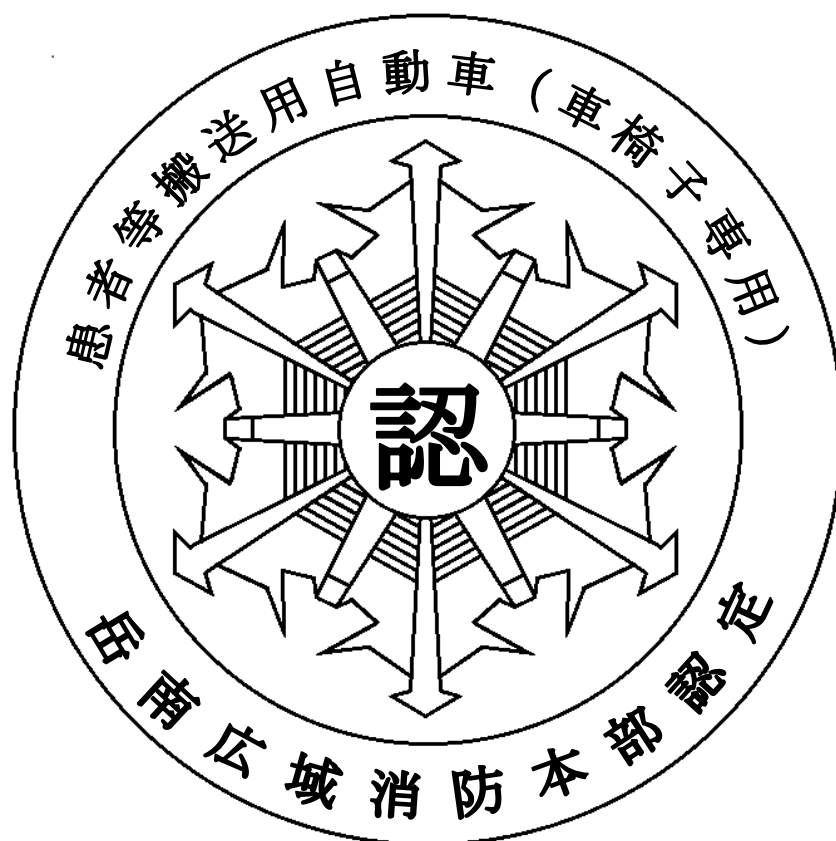
別図4 患者等搬送用自動車認定マーク（車椅子専用）

患者搬送等自動車認定マーク（車椅子専用）は、自動車後面にあつて、運転者の視野を妨げない見やすい位置に貼付するものとする。