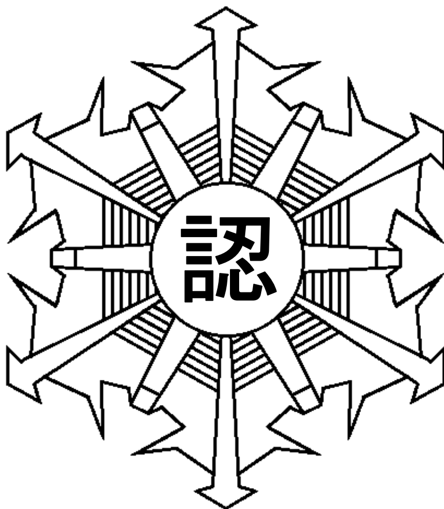
別図1 患者等搬送事業者認定マーク