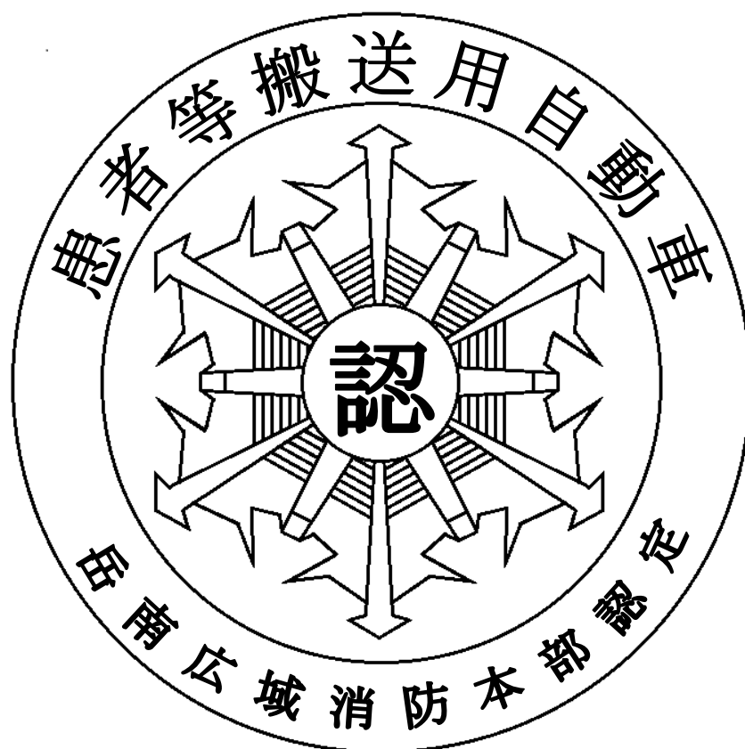
別図2 患者等搬送用自動車認定マーク

患者搬送等自動車認定マークは、自動車後面にあつて、運転者の視野を妨げない見やすい位置に貼付するものとする。